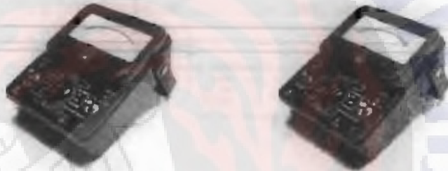
Gambar 1. Citra – citra yang dikenali

Kriteria pengenalan citra dapat ditunjukkan dalam Gambar 1 dan Gambar 2 berikut ini.