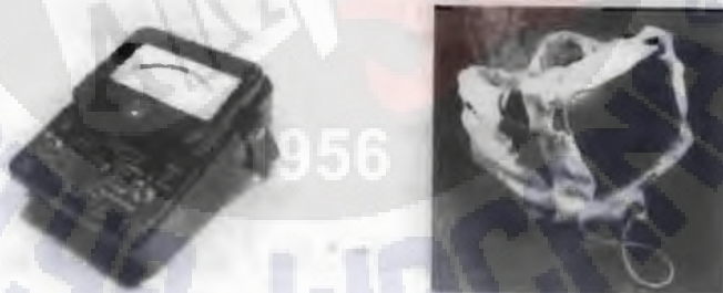
Gambar 2. Citra – citra yang tidak dikenali

Citra-citra yang dikenali ditunjukkan di dalam Gambar 1, di mana sebuah multimeter ditampilkan dalam citra ini. Citra-citra yang tidak dikenali ditunjukkan oleh Gambar 2, di mana citra ini merupakan citra multimeter, komputer.