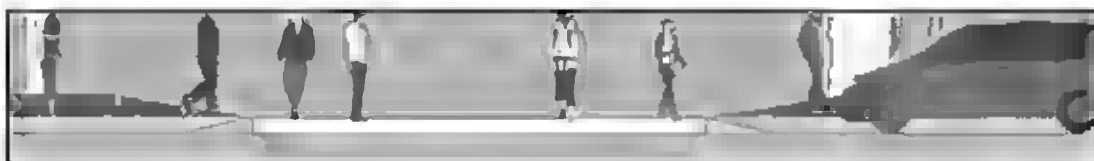
Gambar 7. Potongan (tampak samping) Peninggian Jalan Kendaraan di Titik Persimpangan Jalan Koridor Ruang Terbuka Kampus 1 UKSW

Papan nama gedung dibuat untuk memberikan identitas gedung yang ada, sehingga dapat memberikan kenyamanan bagi pengguna serta memberikan konsistensi dari gedung yang ada