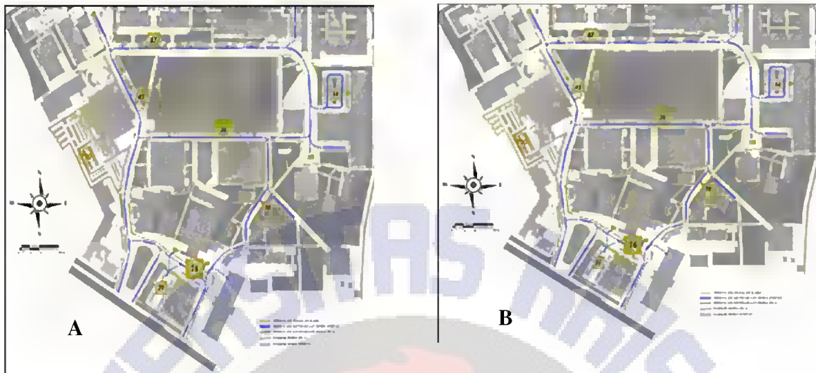
Gambar 2. Permasalahan Jalur Kendaraan dengan Pejalan Kaki (A) dan Permasalahan Parkir Kendaraan Roda Empat (B)

Hasil pengukuran lebar jalan dalam lanskap kampus 1 UKSW dapat dilihat pada Tabel 1 dan Gambar 3.