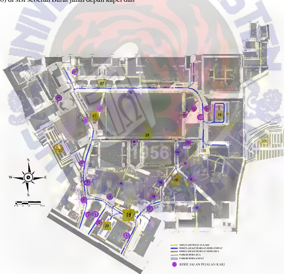
Gambar 4. Peta Sirkulasi Pejalan Kaki Kampus 1 UKSW

Kelas pelayanan pejalan kaki ditentukan dari kepadatan pejalan kaki dan kecepatan berjalan. Kelas pelayanan menentukan kebebasan gerak pejalan kaki dan kemudahan pejalan kaki dalam menentukan arah berjalan, dengan kecepatan tertentu tanpa menimbulkan gangguan antar sesama pejalan kaki.