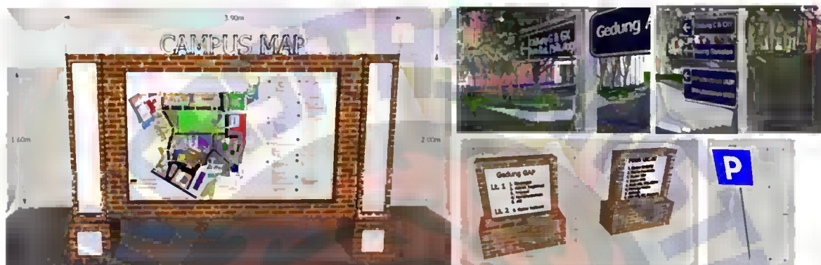
Gambar 8. Peta Kampus, Papan Penunjuk Arah Gedung, dan Papan Nama Gedung Kampus 1 UKSW

Untuk parkir sepeda motor, baik parkir kampus depan maupun parkir Cungkup tetap menggunakan rancangan yang ada. Untuk parkir sepeda motor bagian kampus depan, peletakan tanda parkir penuh dipindah di bagian depan pengambilan kartu parkir, sehingga pengguna parkir yang akan memutar kendaraan tidak mengganggu pengguna yang lain (keamanan). Sedangkan untuk parkir kendaraan roda empat diberikan tambahan papan tanda parkir dan tanda dilarang parkir.