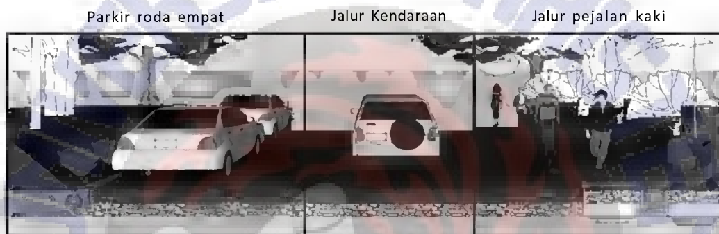
Gambar 6. Potongan Pembagian Badan Jalan Lanskap Ruang Terbuka Kampus 1 UKSW

Tanda parkir dan tanda pengarah gedung dibuat dengan material pipa besi setinggi \pm 2,5 meter dan material papan dari plat aluminium dengan ukuran dan letak yang disesuaikan dengan kenyamanan pengguna, sehingga dapat dengan mudah melihat tanda parkir dan tanda pengarah